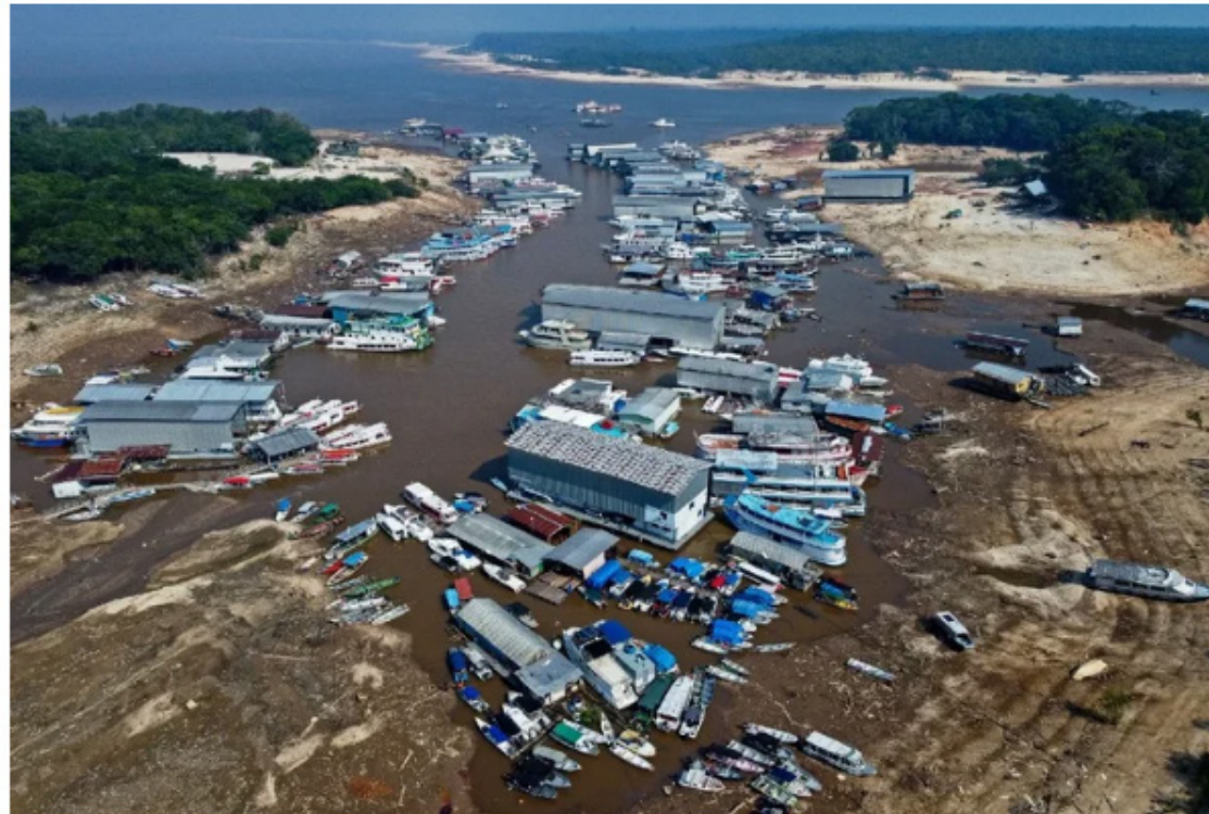
Com a estiagem severa, até quem tinha água na porta de casa sofre com a baixa dos rios

Estudo do Instituto Nacional de Pesquisas Espaciais (INPE) aponta que ao fim de 2023 o nível da água chegou a cair 80% na comparação com média do período de secas