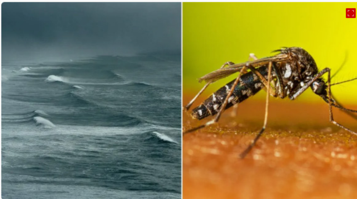
El Niño aumentou infestação do Aedes aegypti em SP, diz estudo